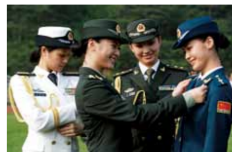
试穿军服的女军官

武警警服包括：春秋常服为橄榄绿色，夏常服为浅橄榄绿色，冬常服为深橄榄绿色，作训服为通用迷彩和数码荒漠迷彩。