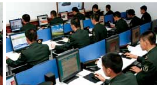
利用多媒体平台延伸教育课堂