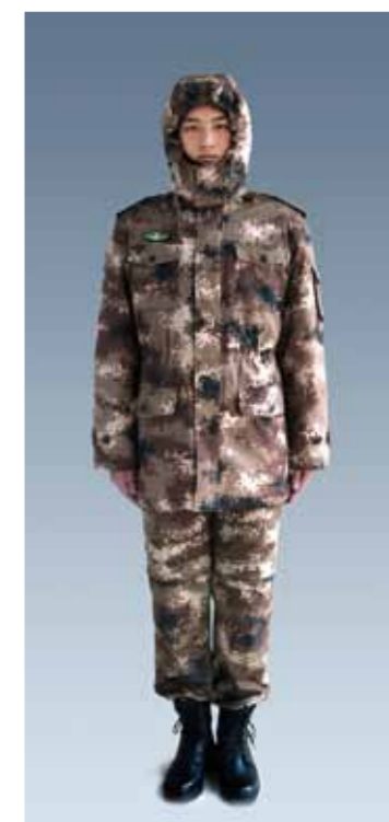
陆军冬季迷彩作训大衣